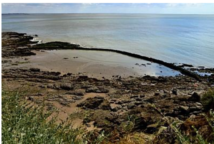
Figure 1 : écluses à poissons à Pornic

Les écluses à poissons sont elles aussi des aménagements anthropiques, même si elles sont anciennes (certaines datent du moyen âge).